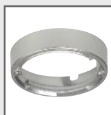
17 x \varnothing 70 mm