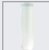
Zylinderglas, matt 55 x 16 mm Art-Nr. 523149