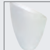
Mini-Schute matt 55 x 40 mm Art-Nr. 523226